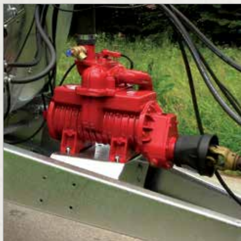
Vakuumska črpalka serije MEC