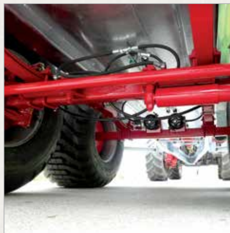
Tandem vzmeteno podvozje z listnatimi vzmetmi