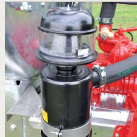
Lovilec olja z dušilcem