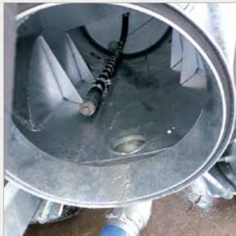
Podpih v sodu (pnevmatsko mešalo)