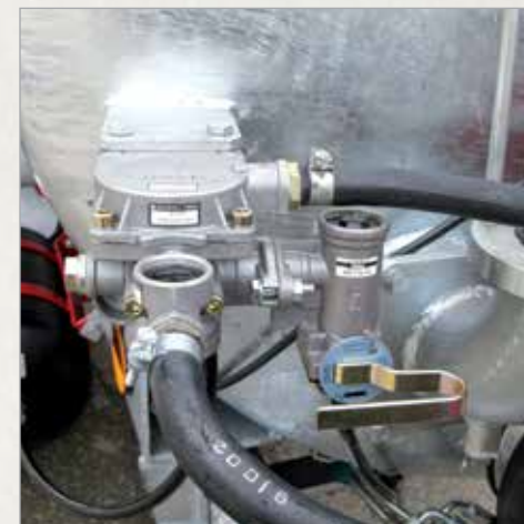
Ročni regulator zavorne sile zračnih zavor