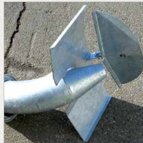
6" razpršilec z zaslonko