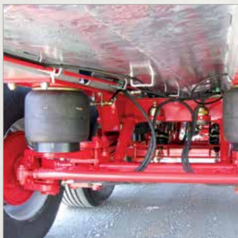
Pnevmatško vzmeteno podvozje