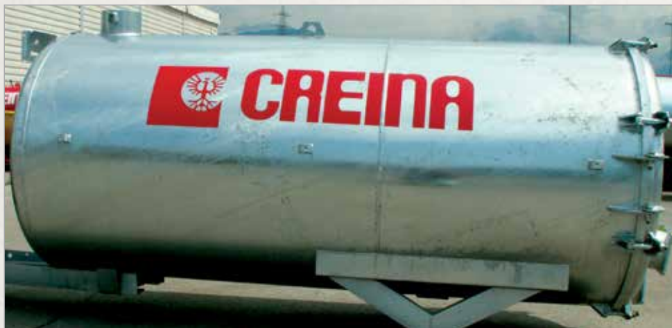
Vročje cinkan sod + pasivizacija