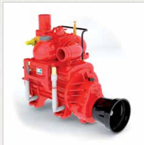
Vakuumska črpalka serije MEC II