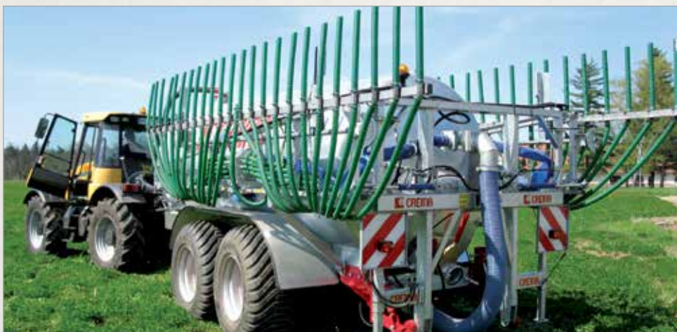
Cevni sistemi za polivanje (dognojevalniki) različnih širin nemškega podjetja Vogelsang