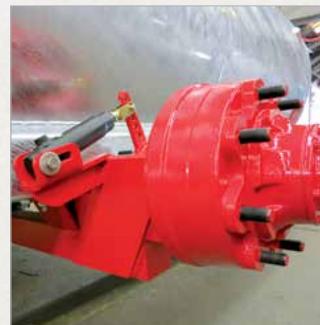
Spuščena osovina za nižje težišče