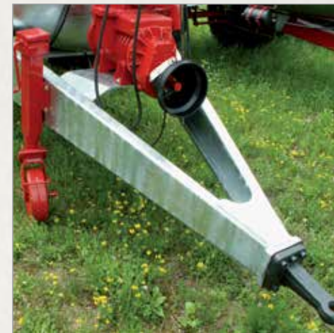
V oblika pocinkanega vlečnega droga