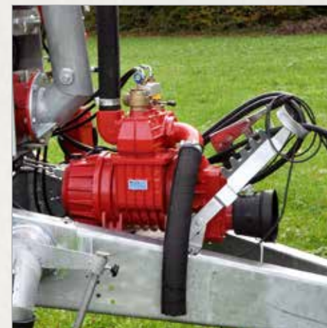
Vakuumska črpalka serije STAR