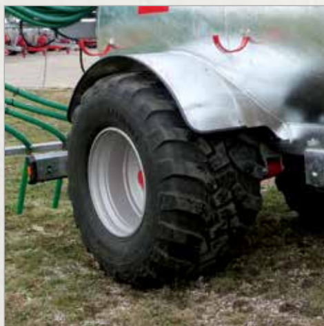
Blatnik enoosna cisterne