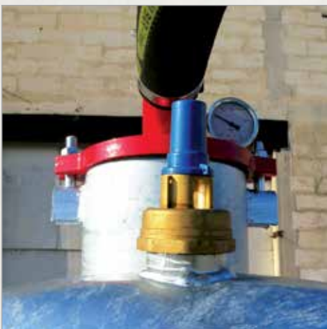
Podtlačni varnostni ventil