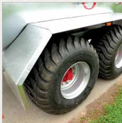
Blatnik tandem cisterne