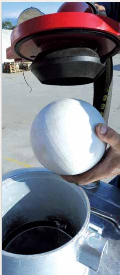
Prelivni varnostni ventil