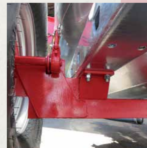
Spuščena osovina za nižje težišče