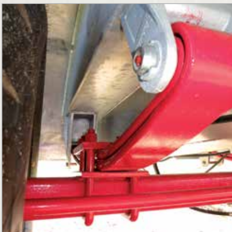
Enoosno vzmetenje z listnatimi vzmetmi