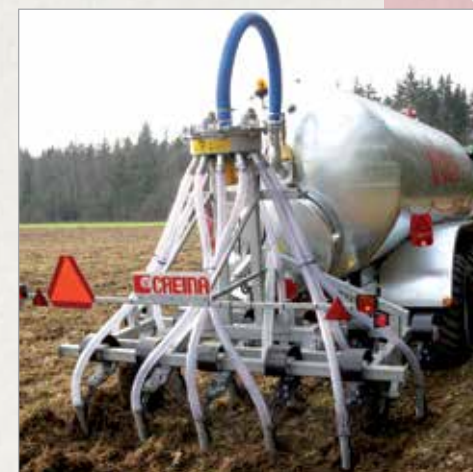
Deponatorji za orno zemljo različnih širin nizozemskega podjetja Sloodsmid