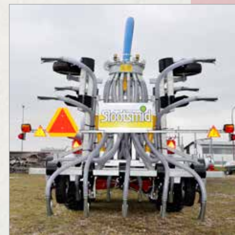
Deponatorji za orno zemljo različnih širin nizozemskega podjetja Sloodsmid