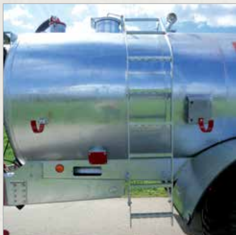
Lestev za dostop do vrha sode in odprtina premera 300 mm z ročnim odpiranjem