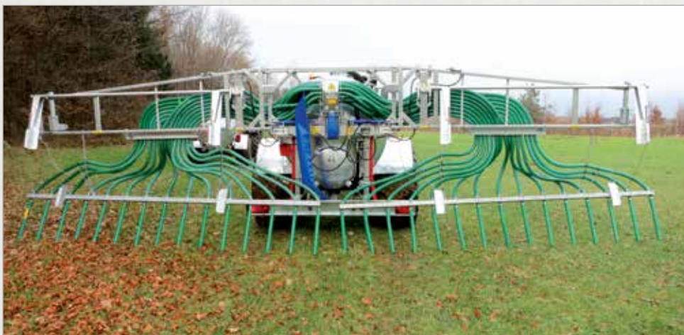
Cevni sistemi za polivanje (dognojevalniki) različnih širin nemškega podjetja Vogelsang