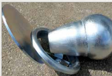
Razpršilec z odbojno ploščo