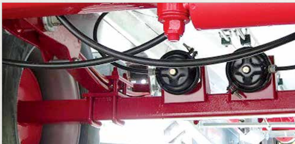
Zračne zavore (enovodne ali dvovodne)