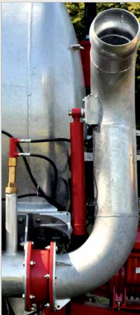
6" ali 8" hidravlična sesalna roka