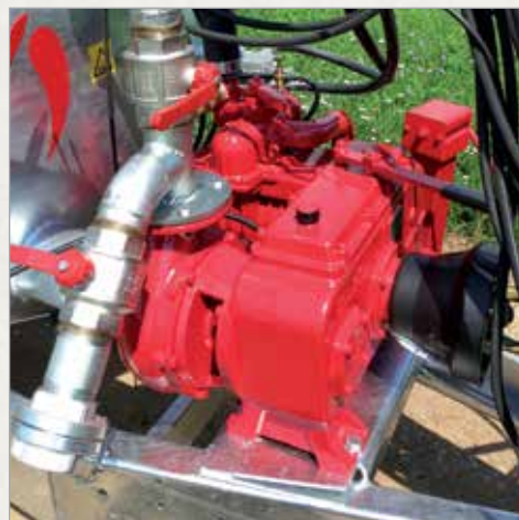
Črpalka serije GARDA (kombinirana vakuumska in centrifugalna črpalka)