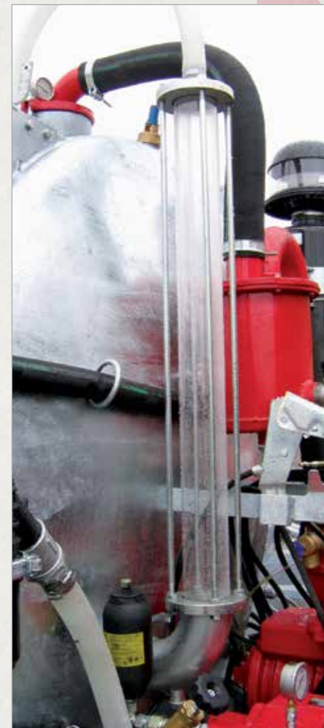
Nivojska cev iz pleksi stekla