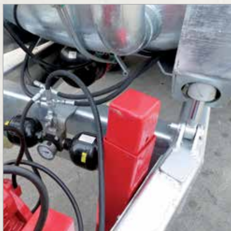
Hidravlično vzmetenje vlečnega droga