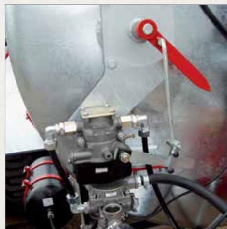
Avtomatski ALB regulator zavorne sile zračnih zavor vezan na kazalo nivoja polnosti