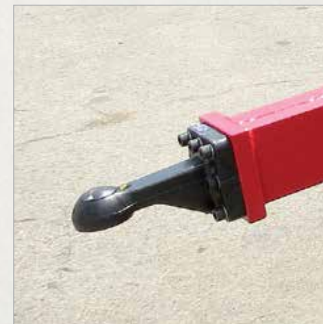
Krogelni priklopnik K80