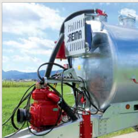
Vakuumska vodno hlajena črpalka serije WPT