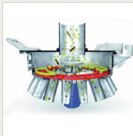
Distribucijska sekalna glava DosiMat