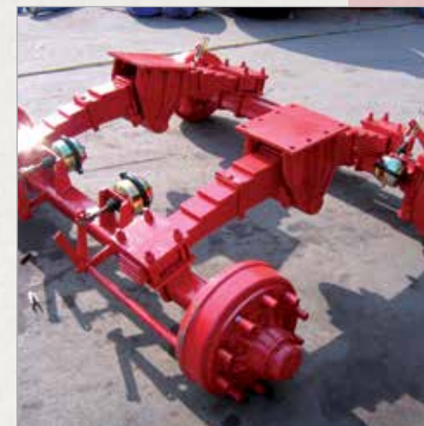
Boogie tandem vzmetno podvozje z listnatimi vzmetmi