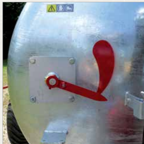
Kazalo nivoja polnosti s plovcem