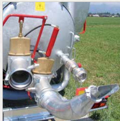
6" razpršilni tulec