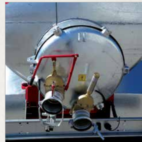
Odprtina \varnothing 900 mm pri cisternah od 6000L dalje