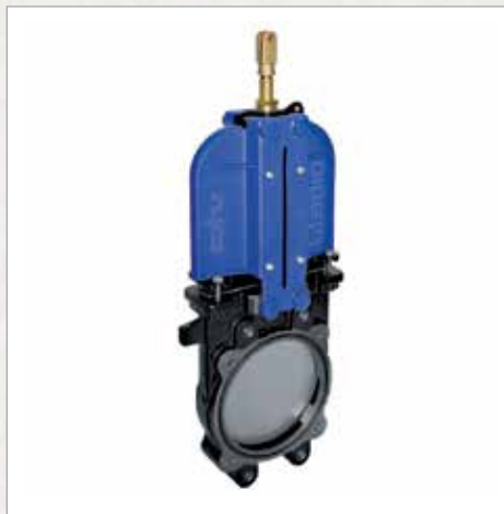
Zasun z dvojno pregrado