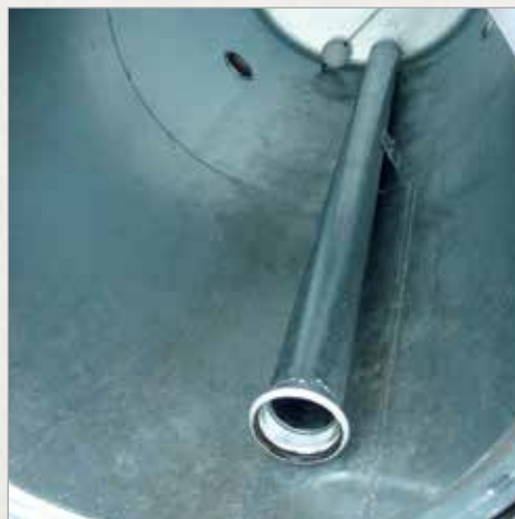
Sistem za popolno praznjenje pri vožnji navzdol