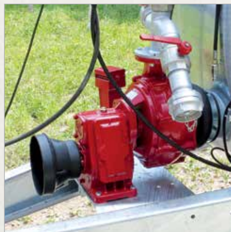
Centrifugalna črpalka serije ELBA