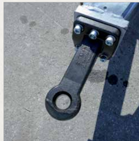
Fiksno priklopno uho premera 50mm (tudi 40mm)