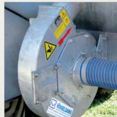
Turbo centrifugalna črpalka za hitrejše polnjenje