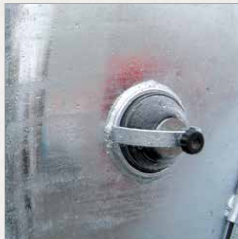
4" stekleno opazovalno okence