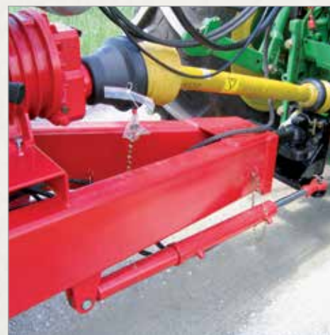
Prisilno krmiljenje podvozja