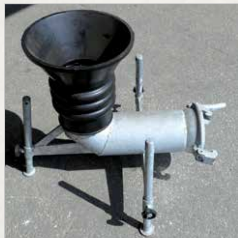
Lijak za sesalno roko