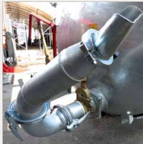
4" razpršilni tulec z 90° kolenom