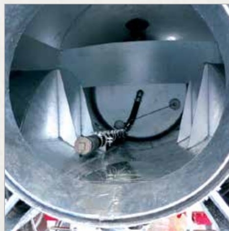
Izrez v sod za kolesa