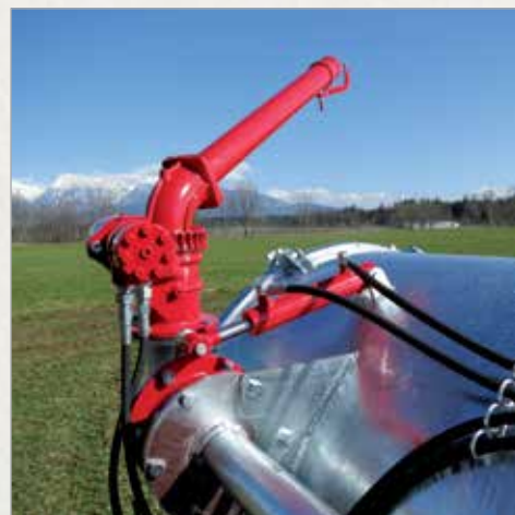
Top VARIO vrtljiv s hidromotorjem in s hidravličnim nagibom