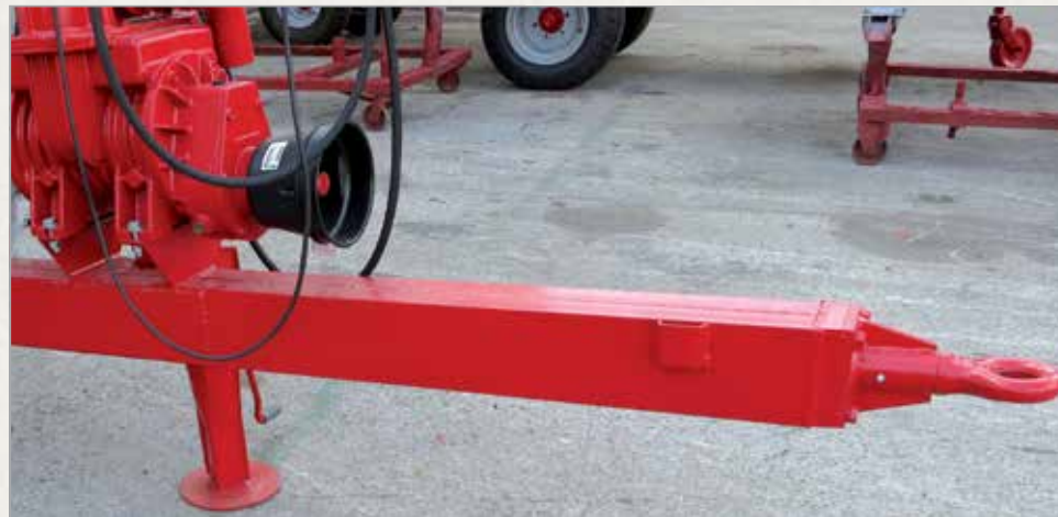
Klasični vlečni drog cistern od 4500L dalje