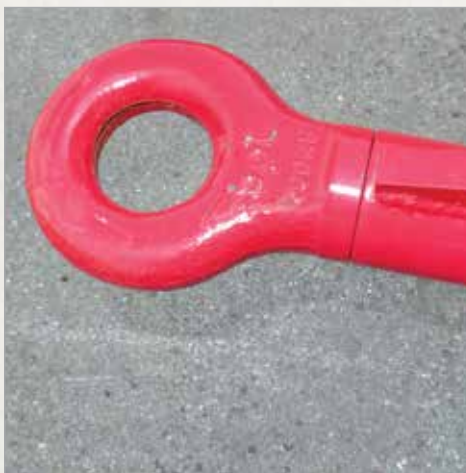
Vrtljivo priklopno uho premera 50mm (tudi 40mm)