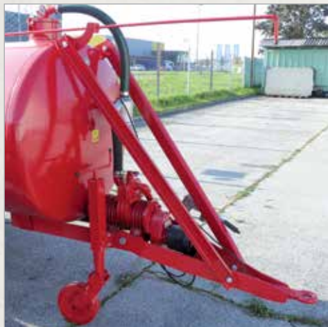
Klasični vlečni drog cistern do 3200L