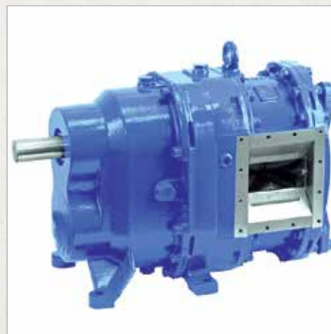
Pretočna črpalka Vogelsang