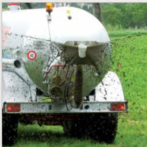
6" razpršilec zavesa