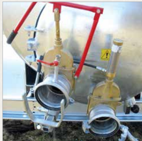
4", 6" ali 8" ročni zasun s hitrim priklopom in 4", 6" ali 8" hidravlični zasun