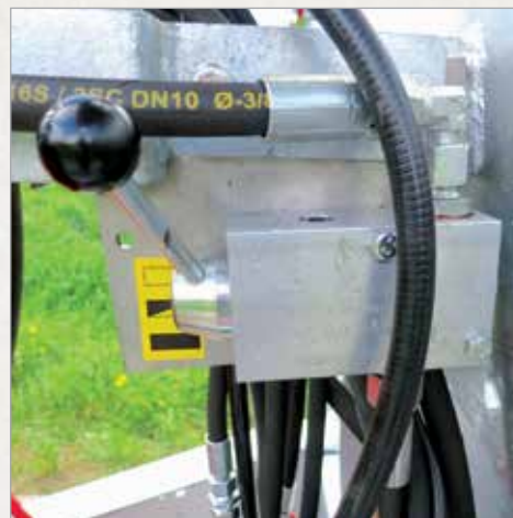
Ročni regulator zavorne sile hidravličnih zavor