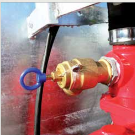
Nadtlačni varnostni ventil