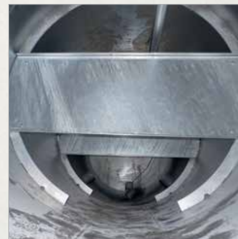
Pregrada proti pluskanju