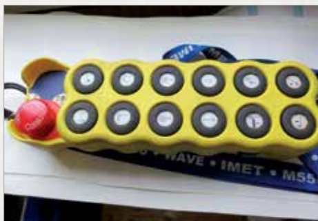
Daljinec za brezžično krmiljenje