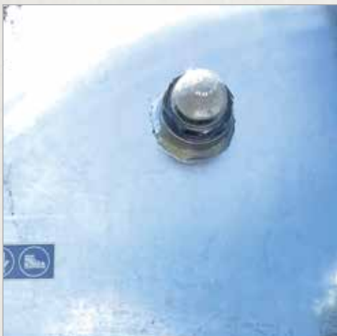
2" opazovalno okence