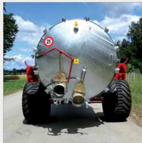
Pri cisternah do 6000L se odpira celotni zadnji pokrov sode