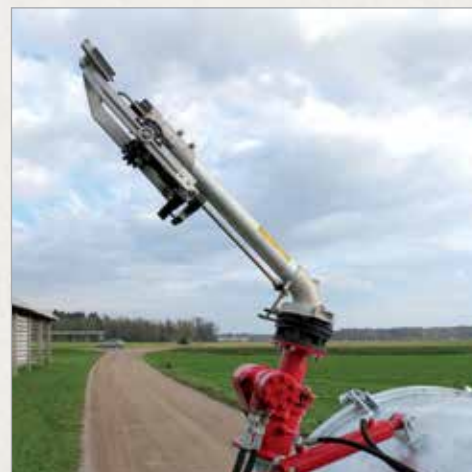
Top REFLEX za namakanje