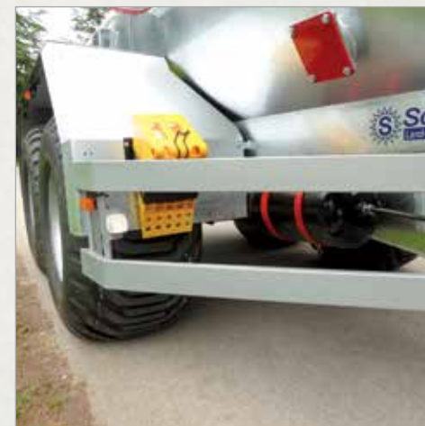
Zaščitni odbijač na boku cisterne