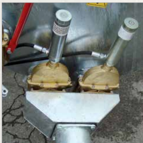
Sistem za popolno praznjenje pri vožnji navzdol